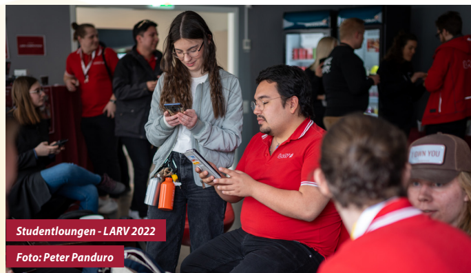
Studentloungen - LARV 2022