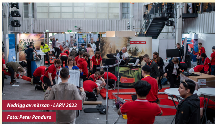
Nedrigg av mässan - LARV 2022

LARV-mässan är vårt huvudevenemang. Till denna samt tillhörande bankett behövs en uppsjö av inventarier som bord, stolar, växter, TV-skärmar och annat som våra utställare kan tänka sig behöva. Vi använder även möbelinventarier i våra lounges ämnade för studenter och representanter från utställare. Som mässpartner ser ni till att förse oss med mässinventarier till ett förmånligt pris.