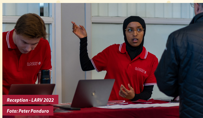
Reception - LARV 2022

Kompetensförsörjning är ett viktigt område inom LARV. Projektet har många områden som kräver kunskap inom service, värdskap, servering och planering etc. Vi vill se till att våra engagerade kan visa upp en kunnighet som inte bara imponerar men även är mer än tillräcklig för att tillgodose alla våra utställares och besökares behov. Förslag på områden hittas på vår hemsida!