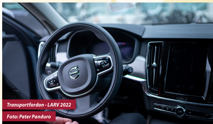
Transportfordon - LARV 2022