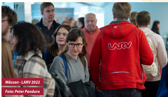
Mässan - LARV 2022