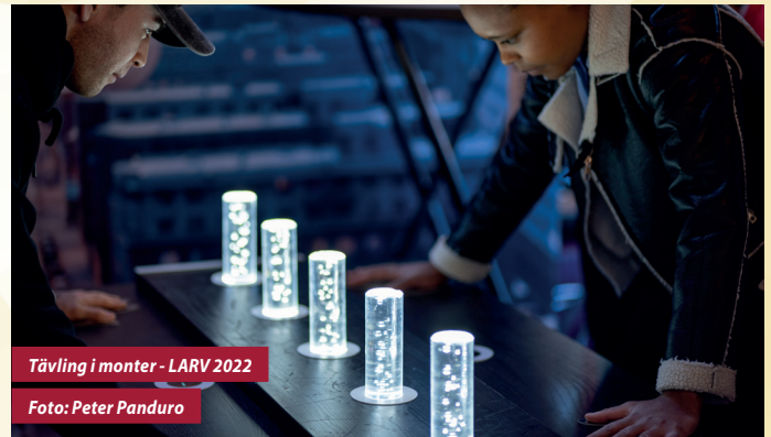
Tävling i monter - LARV 2022

Alla samarbeten är olika så utöver ovanstående så diskuterar vi alltid vilka andra möjligheter som finns för att LARV och våra partners ska kunna skapa så mycket värde för varandra som möjligt.