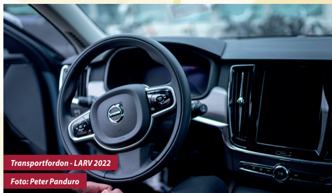
Transportfordon - LARV 2022