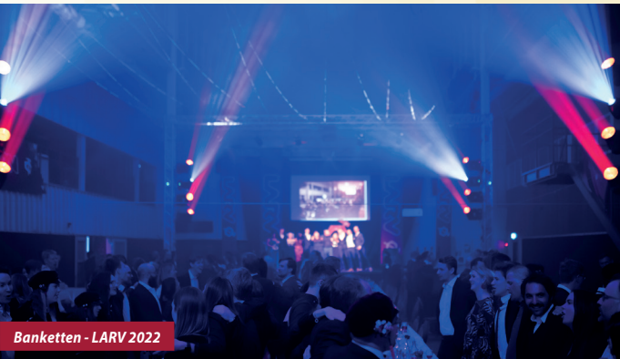
Banketten - LARV 2022