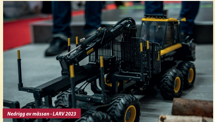
Nedrig av mässan - LARV 2023

Hur en föreläsning eller mässa upplevs är av yttersta vikt för att lämna ett gott intryck hos deltagare och besökare. LARV jobbar aktivt med att snygga till våra receptioner, lounges, banketter, mässområden, föreläsningssalar etc. Om ni är en aktör som tillhandahåller möbler, mässdekor eller inredning eller har god kompetens i hur ett område ska utformas attraktivt så samarbetar vi gärna för att lyfta LARV till nya höjder!