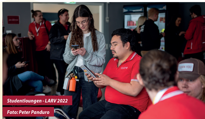
Studentloungen - LARV 2022