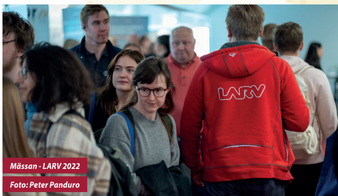
Mässan - LARV 2022