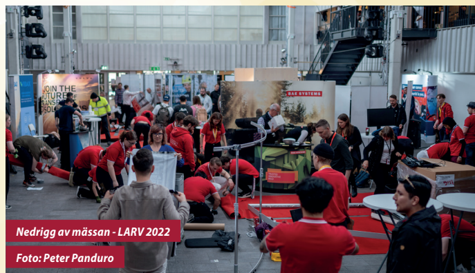
Nedrigg av mässan - LARV 2022

LARV-mässan är vårt huvudevenemang. Till denna samt tillhörande bankett behövs en uppsjö av inventarier som bord, stolar, växter, TV-skärmar och annat som våra utställare kan tänka sig behöva. Vi använder även möbelinventarier i våra lounges ämnade för studenter och representanter från utställare. Som mässpartner ser ni till att förse oss med mässinventarier till ett förmånligt pris.