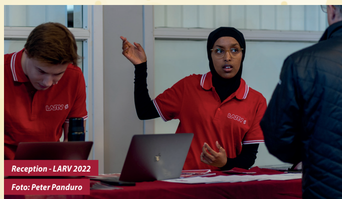
Reception - LARV 2022

Kompetensförsörjning är ett viktigt område inom LARV. Projektet har många områden som kräver kunskap inom service, värdskap, servering och planering etc. Vi vill se till att våra engagerade kan visa upp en kunnighet som inte bara imponerar men även är mer än tillräcklig för att tillgodose alla våra utställares och besökares behov. Förslag på områden hittas på vår hemsida!